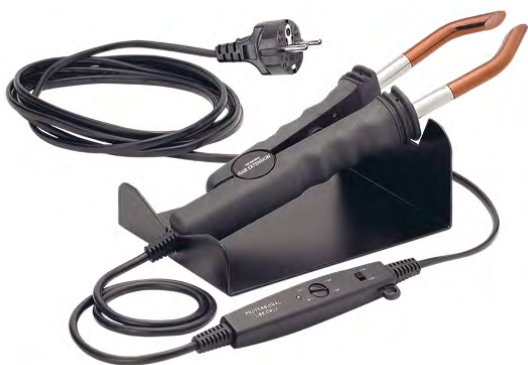
SUPER KIT 2005