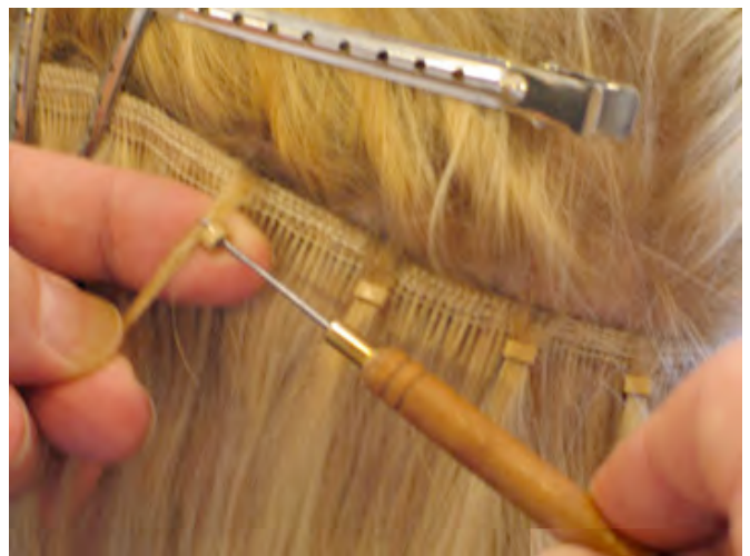
STAP 4 Breng het haarstuk op maat en knip het op de gewenste lengte af.