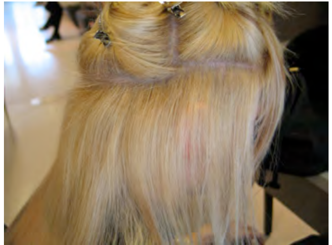
STAP 2 Maak verdelingen waar men het haarstuk wil plaatsen.