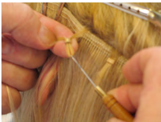
STAP 6 Trek met de haakpen de haarlok door het ringetje.