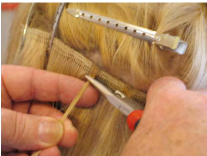
STAP 7 Breng het ringetje tot onder het haarstuk en knijp het stevig plat.