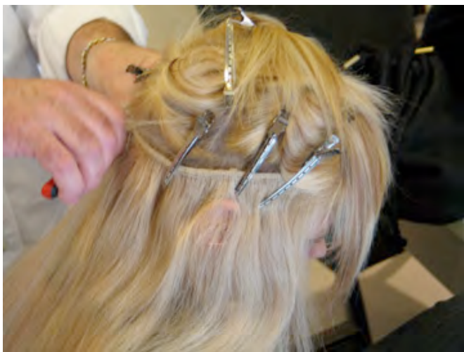
STAP 3 Zet het haarstuk vast met clips.