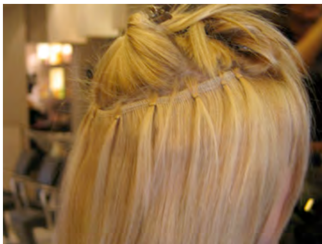
STAP 10 Herhaal deze stappen.