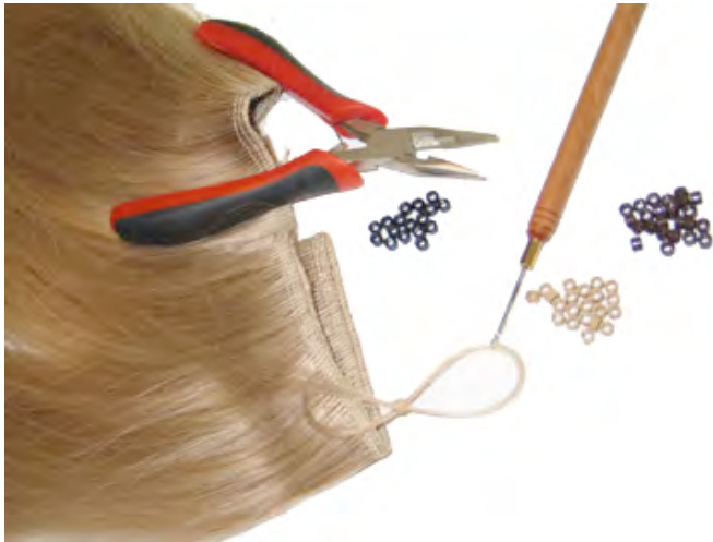
STAP 1 De materialen om het Ringon systeem te plaatsen: een haakpen, ringetjes en een tangetje.

Ringetjes bevestigen de haarbanden aan het hoofd – een eenvoudige techniek en in minder dan een uur geplaatst. Verkrijgbaar in 28 kleuren, lengte 50cm en breedte +/- 100cm (100gr), per stuk. Kleuren: 1, 2, 4, 5, 6, 8, 10, 11, 12, 14, 17, 20, 24, 26, 27, 30, 32, 33, 35, 130, 530, M18/24, MG2, MG3, MG4, M12/MG2, M266, ICE.