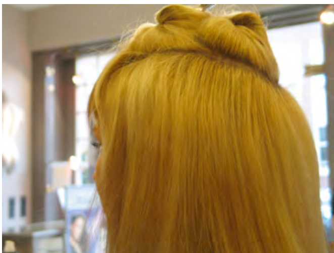
STAP 9 Het haarstuk is geplaatst.